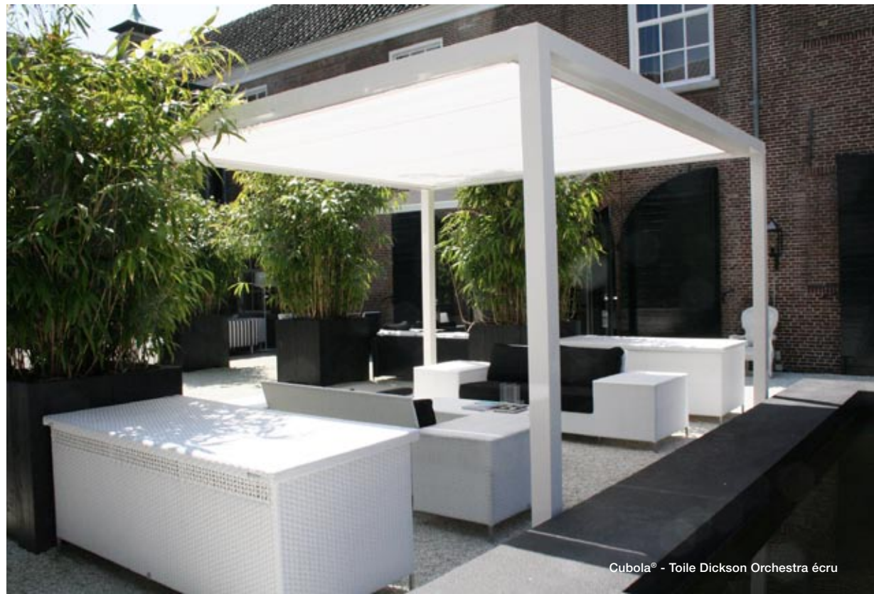
Cubola® - Toile Dickson Orchestra écu