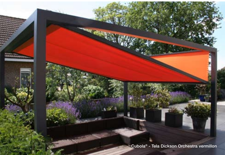
Cubola® - Tela Dickson Orchestra vermillon

Quest'estate, la pergola si libera dagli schemi classici e il concept olandese Cubola® propone audaci geometrie, simili all'origami, grazie alle tele di protezione solare Dickson. Selezionando le gamme Sunworker, Orchestra Max (tecnologia autopulente) o Alto FR (tela ignifuga), Cubola® piega la tela alle vostre esigenze ed offre un design essenziale e innovativo alla nuova dimensione dello spazio outdoor!