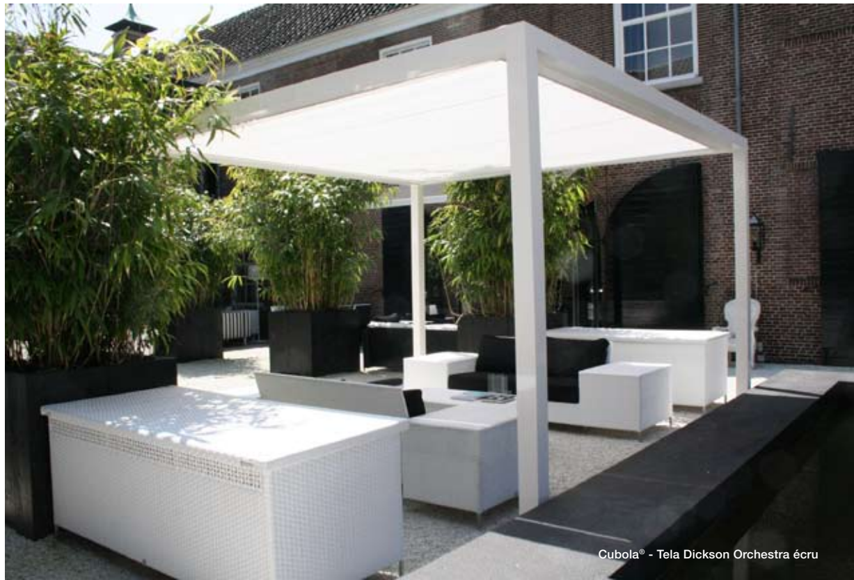
Cubola® - Tela Dickson Orchestra é cru