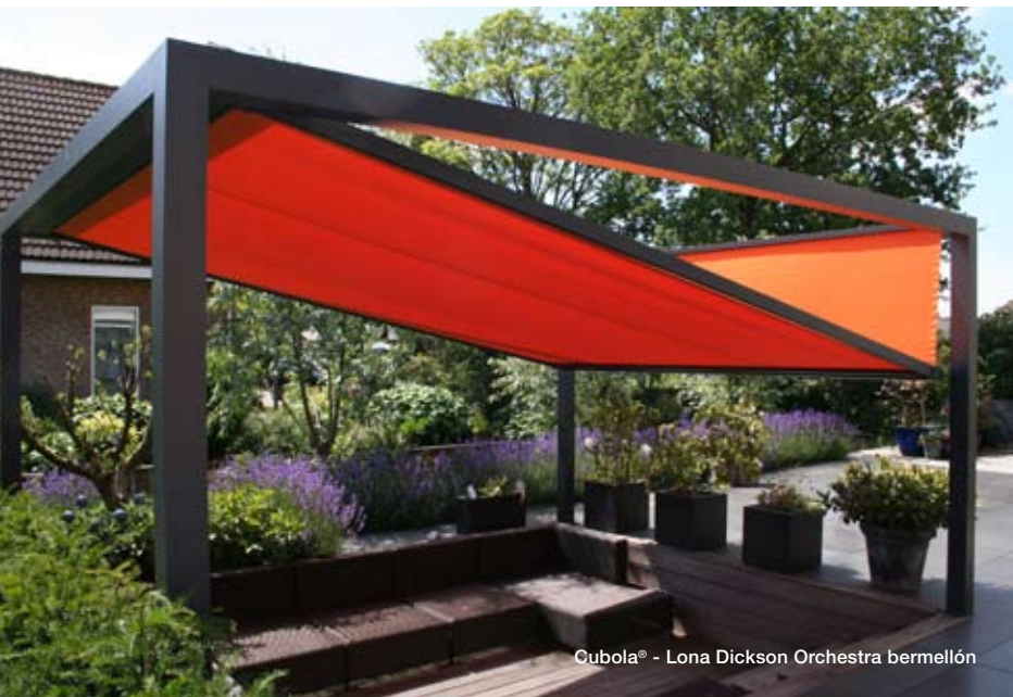
Cubola® - Lona Dickson Orchestra bermellón

Este verano, la pérgola se libera de los cánones clásicos y el concepto holandés Cubola® se atreve con diseños geométricos que recuerdan al origami en las lonas de protección solar Dickson. Con la selección de gamas Sunworker, Orchestra Max (de tecnología autolavable) o Alto FR (lona ignífuga), el Cubola® hace lo imposible para ofrecer un diseño gráfico e innovador, a estas nuevas protagonistas del espacio, para vivir y disfrutar.