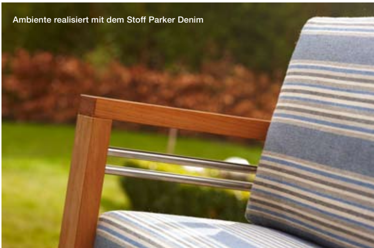
Ambiente realisiert mit dem Stoff Parker Denim