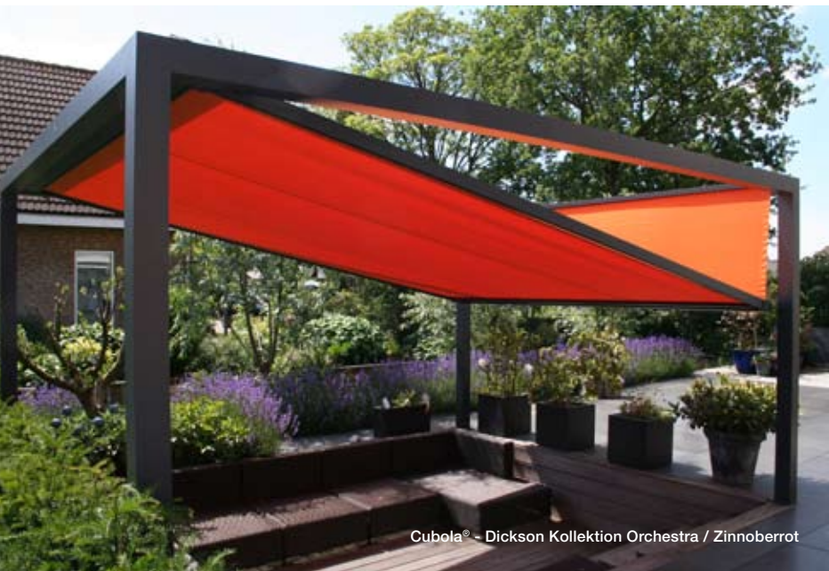
Cubola® - Dickson Kollektion Orchestra / Zinnoberrot

Pergolas und Sonnensegel erleben diesen Sommer einen wahren Aufschwung – in einer neuen Form, die alles Bisherige hinter sich lässt. Das aus Holland stammende Cubola®-Konzept setzt auf strenge Geometrien und erinnert dank Dickson Sonnenschutzstoffen auch an die klassische Kunst des Origami. Cubola® steht für eine klare, innovative Formensprache und die top-moderne Erschließung von Outdoor-Wohn- und Lebenswelten. Ideal für diesen Ansatz, Außenräume neu zu erleben, sind die Kollektionen Sunworker, Orchestra Max (mit Selbstreinigungs-Nanotechnologie) oder auch das flammhemmende Gewebe Alto FR.