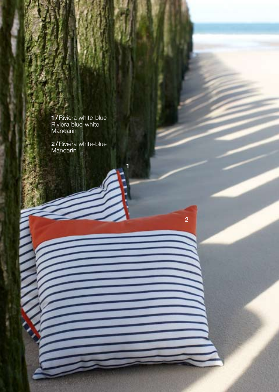
1 / Riviera white-blue Riviera blue-white Mandarin