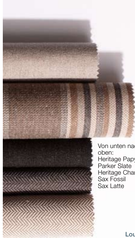
Von unten nach oben: Heritage Papyrus Parker Slate Heritage Char Sax Fossil Sax Latte